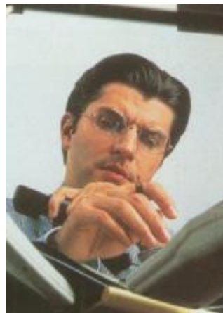
Due incontri per commercialisti

Il secondo appuntamento, sempre per oggi, è in via della Pace 178 con la conclusione del corso organizzato dall'Istituto di dinamiche educative alternative di Curno (Bergamo), in collaborazione con lo Studio legale Spillare e Banca Mediolanum ed accreditato per la formazione professionale continua dall'Ordine dei commer-